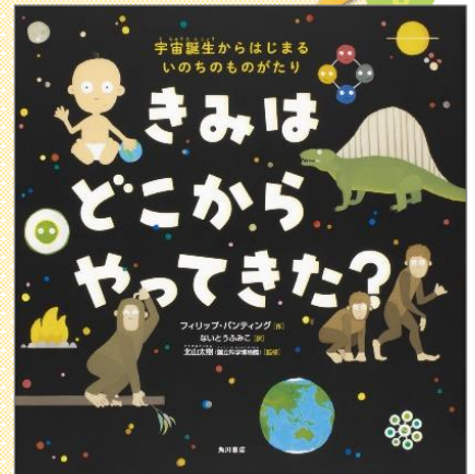
『きみはどこからやってきた?』 —宇宙誕生からはじまるいのちのものがたり— フリリップ・バンティング〓作、ないとう ふみこ〓訳 北山 太樹〓監修、KADOKAWA、E/6 (低学年向け)

古くから日本で作られてきた伝統の和紙。この本では新潟の小出和紙、小国和紙、門出和紙も紹介されています。