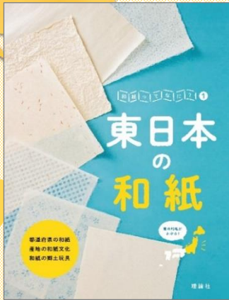
『和紙ってなに? 1』 —東日本の和紙—

古くから日本で作られてきた伝統の和紙。この本では新潟の小出和紙、小国和紙、門出和紙も紹介されています。