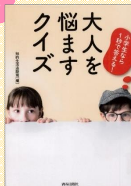
『小学生なら1秒で答える！大人を悩ますクイズ』 知的生活追跡班〓編、青春出版社、031/S