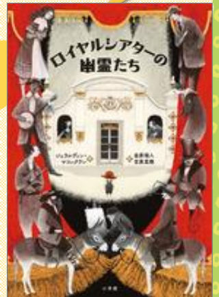
『ロイヤルシアターの幽霊たち』