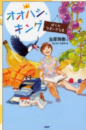
『オオハシ・キング』 —ぼくのなまいきな鳥—

ふしぎな卵から生まれたのは、人間と会話ができる伝説の鳥「キンちゃん」！キンちゃんと拓真くんのどたばたな日々が始まりです。