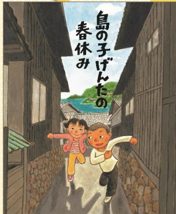
『島の子げんたの春休み』 荒尾 美知子〓文、福田 若緒〓絵 あすなる書房、E/7 (低学年向け)

宇宙が生まれてから 138億年！ この 138億年のなかでたくさんの奇跡のようなことがあって、みんなが生まれたんだよ。